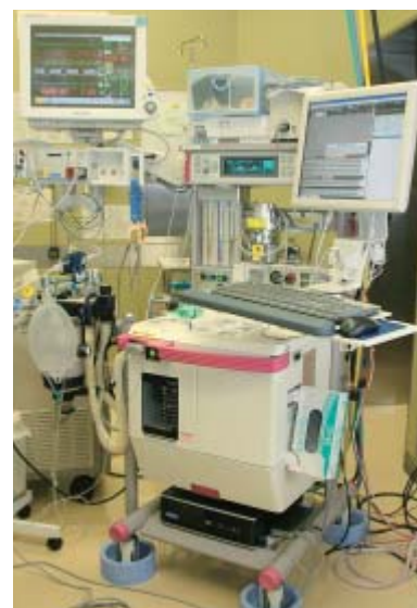
麻酔手術管理システム