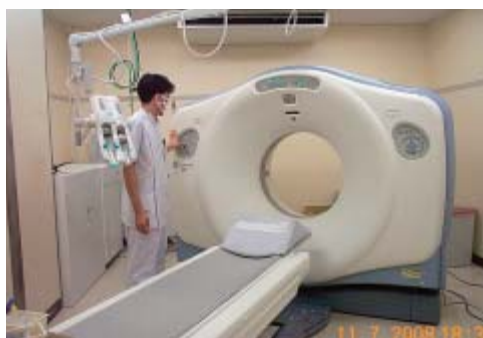
64列マルチスライス